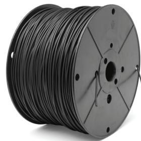
CAVO PERIMETRARE ROBUSTO, Ø3.4MM 522 91 41-02