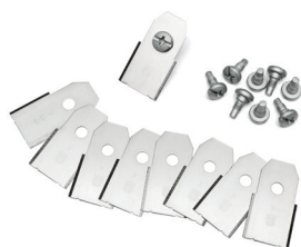
LAME DOPPIO TAGLIENTE - ROBOT TAGLIAERBA AUTOMOWER 577 86 46-03