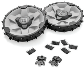
KIT PER TERRENI IRREGOLARI AUTOMOWER® 587 23 53-01