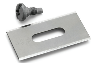
LAME ENDURANCE - ROBOT TAGLIAERBA AUTOMOWER 595 08 44-01