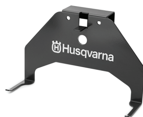
SUPPORTO A MURO PER AUTOMOWER® 587 22 40-01