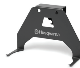
SUPPORTO A MURO PER AUTOMOWER® 597 70 36-01