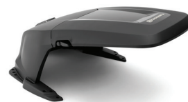
COPRISTAZIONE AUTOMOWER® (MODELLI AWD) 597 63 53-01