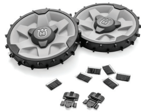
KIT PER TERRENI IRREGOLARI AUTOMOWER® 597 70 54-01