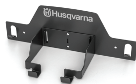
SUPPORTO A MURO PER AUTOMOWER® 585 01 97-02