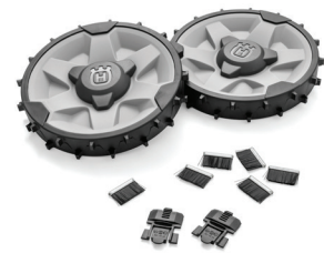
KIT PER TERRENI IRREGOLARI AUTOMOWER® 581 88 97-02