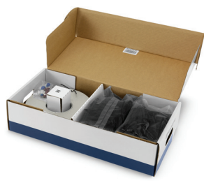
KIT INSTALLAZIONE MEDIO - ROBOT TAGLIAERBA AUTOMOWER® 967 97 22-01