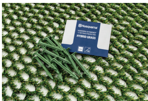
HYBRID GRASS 598 89 60-01