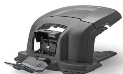
COPRISTAZIONE AUTOMOWER® (420/430X/440/450X/550/520) 585 01 94-01