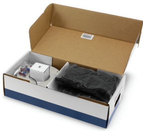
KIT INSTALLAZIONE PICCOLO - ROBOT TAGLIAERBA AUTOMOWER® 967 97 21-01