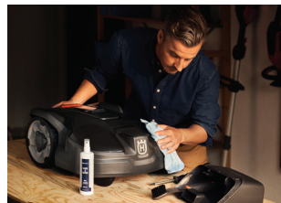
KIT DI PULIZIA PER AUTOMOWER® 590 85 51-01