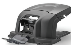
COPRISTAZIONE AUTOMOWER® (305/310 MK II/315 MK II/405X/415X) 587 23 61-01