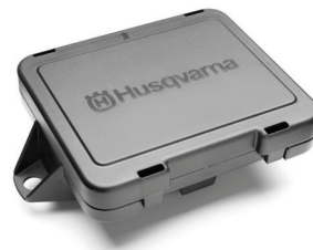
CUSTODIA DI PROTEZIONE PER CONNETTORI 590 85 50-01