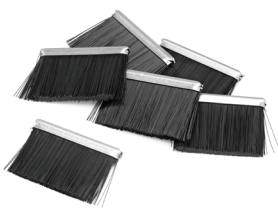
KIT SPAZZOLE PER RUOTE 505 13 28-03