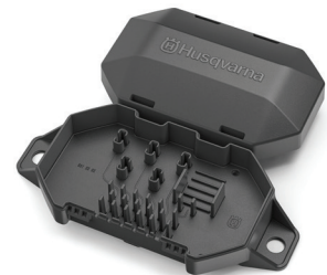
BOX DI PROTEZIONE PER CONNESSIONI PER AUTOMOWER® 599 80 17-01