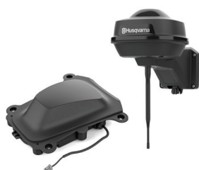
HUSQVARNA EPOS™ PLUG-IN KIT 970 66 34-01