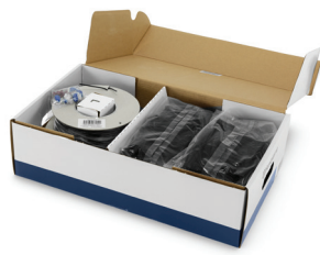
KIT INSTALLAZIONE GRANDE - ROBOT TAGLIAERBA AUTOMOWER® 967 97 23-01