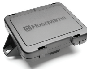
CUSTODIA DI PROTEZIONE PER CONNETTORI 590 85 50-01