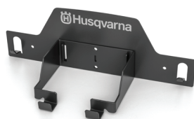
SUPPORTO A MURO PER AUTOMOWER® 585 01 97-02