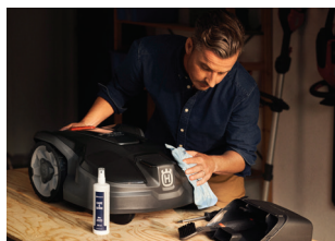
KIT DI PULIZIA PER AUTOMOWER® 590 85 51-01