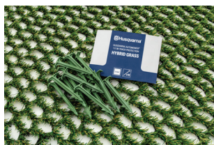
HYBRID GRASS 598 89 60-01