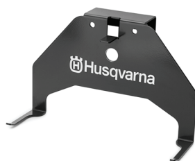
SUPPORTO A MURO PER AUTOMOWER® 587 22 40-01