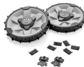
KIT PER TERRENI IRREGOLARI AUTOMOWER® 581 88 97-02