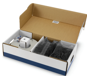
KIT INSTALLAZIONE MEDIO - ROBOT TAGLIAERBA AUTOMOWER® 967 97 22-01