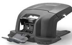
COPRISTAZIONE AUTOMOWER® (305/310 MK II/315 MK II/405X/415X) 587 23 61-01