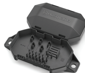
BOX DI PROTEZIONE PER CONNESSIONI PER AUTOMOWER® 599 80 17-01