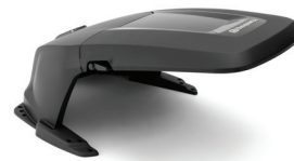
COPRISTAZIONE AUTOMOWER® (MODELLI AWD) 597 63 53-01