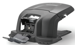
COPRISTAZIONE AUTOMOWER® (420/430X/440/450X/550/520) 585 01 94-01