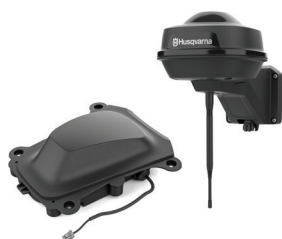
HUSQVARNA EPOS™ PLUG-IN KIT 970 66 34-01