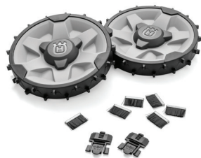
KIT PER TERRENI IRREGOLARI AUTOMOWER® 597 70 54-01