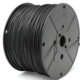
CAVO PERIMETRARE ROBUSTO, Ø3.4MM 522 91 41-02