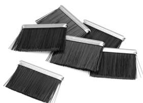
KIT SPAZZOLE PER RUOTE 505 13 28-03