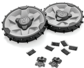
KIT PER TERRENI IRREGOLARI AUTOMOWER® 587 23 53-01