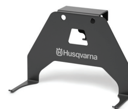
SUPPORTO A MURO PER AUTOMOWER® 597 70 36-01