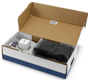
KIT INSTALLAZIONE PICCOLO - ROBOT TAGLIAERBA AUTOMOWER® 967 97 21-01