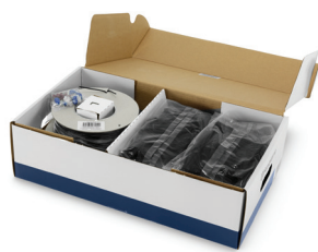
KIT INSTALLAZIONE GRANDE - ROBOT TAGLIAERBA AUTOMOWER® 967 97 23-01