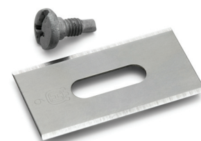
LAME ENDURANCE - ROBOT TAGLIAERBA AUTOMOWER 595 08 44-01